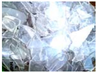
水銀除去後のガラス