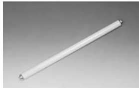
使い終わった蛍光管